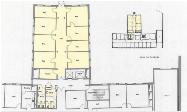
Grundriss 4. Obergeschoss