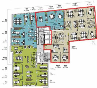
Grundriss 2. OG NM74